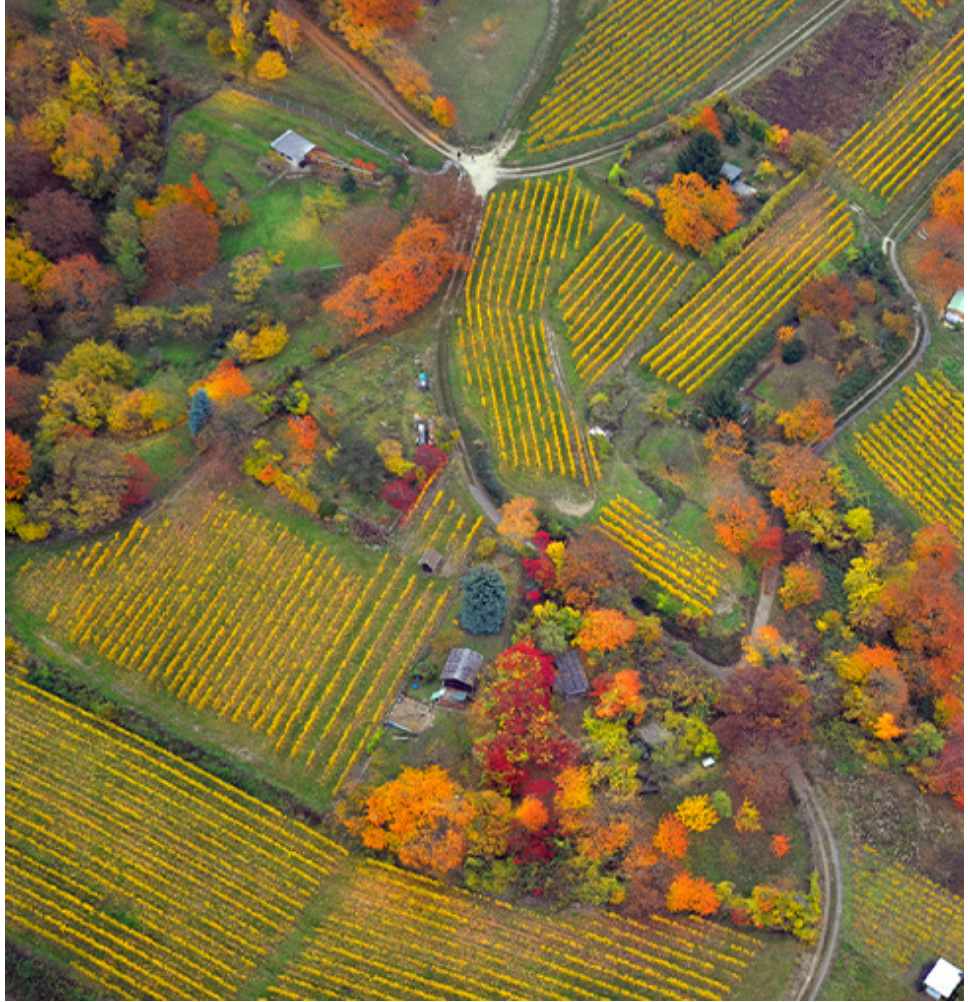
Eindrucksvoller Blick auf Wege der hessischen Landschaft.